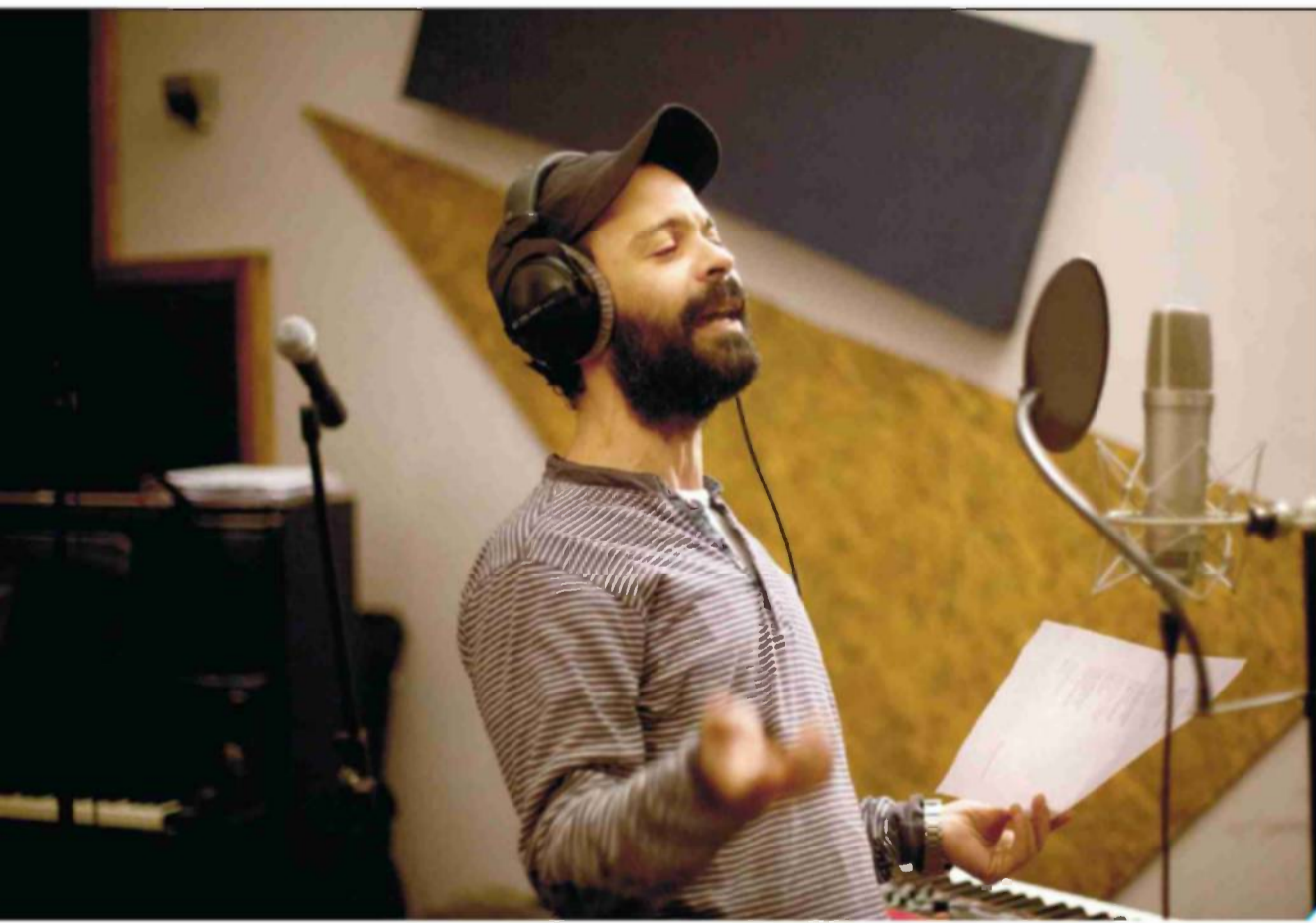
"אני רוצה שערבים מסוימים, שרוצים לצאת מהכלא הפנימי, יקשיבו לאלבום הזה". בניון

אבל החזן של בניון לא נעצר בכניסה למועדונים ערביים. בשיריו בערבית הוא מבקש